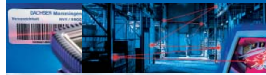
Case example: depiction of all articles taken from stock, and precise depiction of other pertinent product information incl. use-by dates, batch numbers etc.